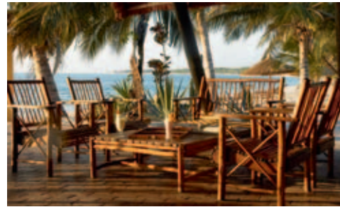
Pestana Bazaruto Lodge