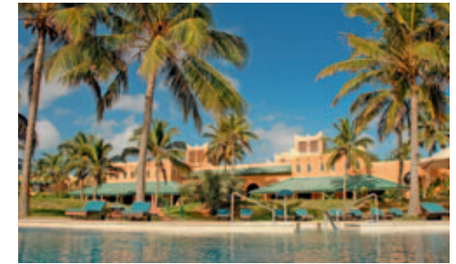
Pemba Beach Hotel and Spa