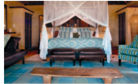
Marlin Lodge, Luxury Beach Chalet

Alle wichtigen Informationen ersehen Sie aus der Preisliste.