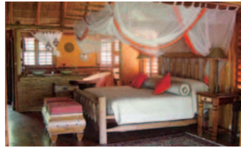
Benguerra Lodge, Villa

Einrichtung: Die luxuriöse Lodge liegt in einem tropischen Garten mit Baumbestand. Die Unterkunft besteht aus 14 riegrasgedeckten Suiten (genannt Casitas, Cabanas und Bungalows) auf einer Holzplattform, welche über Bad und Dusche, WC, Deckenventilator, Moskitonetz, Minibar und eigene Veranda verfügen. Im unter schattenspendenden Bäumen liegenden Hauptgebäude ist der Aufenthalts- und Essraum sowie die Bar und ein kleiner Curio-Shop. Ein schöner Pool bietet sich auf den Strand.