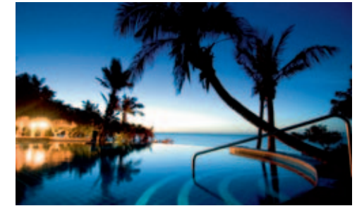
Pool bei Sonnenuntergang

Einrichtung: Das luxuriöse Resort verfügt über 30 Beach Chalets (davon ein Honeymoon Chalet) mit Bad, Innen- und Aussendusche, WC, Klimaanlage, Minibar, Safe, Fernseher und eigener Veranda. Für noch höhere Ansprüche gibt es 12 Bayview Villas (mit je 2 Schlafzim-