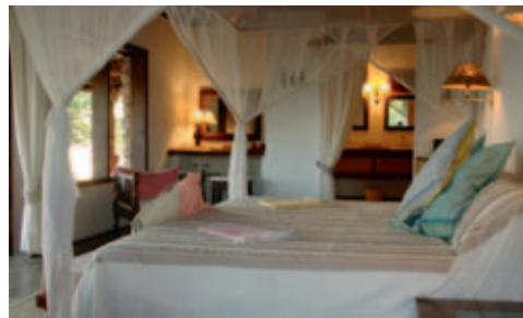
Quilálea Lodge, Villa

Einrichtung: Die Lodge besteht aus 9 Villas (60 m 2 ) mit Palmlätterdach. Jede Villa verfügt über Dusche, WC, eigene Veranda (mit Hängematte!), Minibar, Klimaanlage und Deckenventilator. Eingerichtet und dekoriert sind alle Villas in einer Kombination aus arabischem und afrikanischem Stil. Vom Restaurant aus bietet sich eine herrliche Sicht auf den Indischen Ozean; die Bar bietet Blick auf die Lagune.