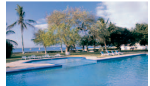
Pestana Inhaca Lodge

Windsurfing und Kanufahrten sind kostenlos; gegen Gebühr sind weitere Wassersportarten wie Tauchen, Wasserskifahren, Segeln, Fischer- ausflüge sowie Bootsausflüge nach Portugese Island oder Santa Maria möglich. Mit dem hauseigenen Geländefahrzeug können auch der Leuchtturm und das Marine Biologie Museum besucht werden.