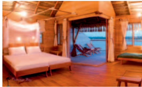
Flamingo Bay Water Lodge

Einrichtung: Unter schattenspendenden Palmen am traumhaften Sandstrand. Alle 20 Casitas (Chalets mit Riedgrasdach) verfügen über Dusche, WC und haben Strandsicht. Im riedgrasgedeckten Hauptgebäude befindet sich die Bar, der Ess- und der Aufenthaltsraum. Kleines Schwimmbad vorhanden. Zu den Aktivitäten gehören Tauchen, Schnorcheln, Segeln, Dhow-Kreuzfahrten und Reiten. Das bestens ausgerüstete Tauchcenter verfügt über alle notwendige Ausrüstung. Innerhalb einer vernünftigen Distanz zur Lodge stehen 15 Reefs (Tauchtiefe zwischen 8 und 30 Meter) zur Verfügung.