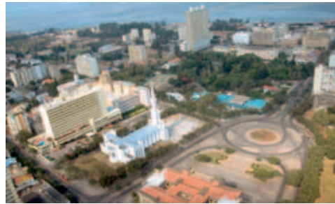
Pestana Rovuma Hotel

Einrichtung: Über 180 klimatisierte, elegante Zimmer und Suiten verfügen über allen Komfort. Gutes Restaurant mit eigener Veranda. Gediegene, altherwürdige Bar und hauseigenes Casino. Das Schwimmbad mit Liegewiese liegt im grossen, gepflegten Garten. Die separate Sunset-Bar im Garten bietet einen herrlichen Ausblick auf die Bucht von Maputo. Tennisplätze sind vorhanden.