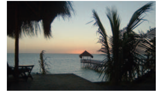
Dugong Beach Lodge

Einrichtung: 14 Luxury Beach Chalets und 3 Suiten verfügen über Klimaanlage und Moskitonetz, Dusche, WC sowie eigene Veranda mit Zugang zum Strand. Im Hauptgebäude befindet sich der Essraum, die Bar, die Lounge und ein kleiner Curio-Shop. Schwimmbad vorhanden. Zu den Aktivitäten gehören Segeln, Tauchen, Schnorcheln, Windsurfen, Wasserskifahren und Katamaransegeln. Auch werden Ausflüge auf der Insel sowie kurze Dhowkreuzfahrten angeboten.