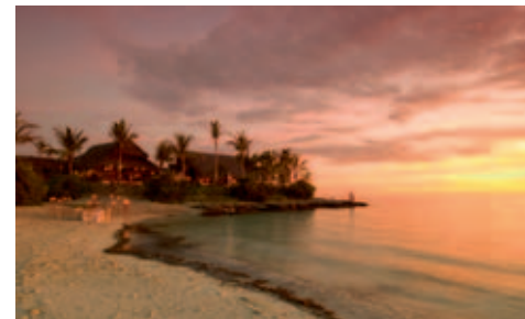
Matemo Island Resort

Alle wichtigen Informationen ersehen Sie aus der Preisliste.