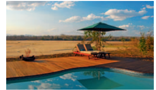
Lugenda Wilderness Camp, Lugenda River

Einrichtung: 8 luxuriöse Safarizelte (moskitosicher, mit Bad, Dusche, WC, Safe, Deckenventilator und privater Veranda) liegen auf Holzplattformen nur wenige Meter vom (oft ausgetrockneten) Lugenda River entfernt. Zum Erholen steht eine grosszügige, riedgrasgedeckte Lounge zur Verfügung (dort wird auch gegessen) und ein kleines Schwimmbad (mit Liegestühlen und Sonnenschirmen) lässt vergessen, dass man sich mitten in der Wildnis