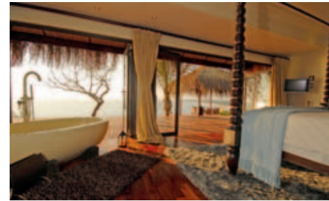
Bay View Suite

Die Lodge ist bei Tauchern sehr beliebt; alle Wassersportarten werden aber gross geschrieben. Tauchen, Schnorcheln, Segeln, Wasserski und Bootsausflüge sind ebenso möglich wie das Erkunden der Insel im Geländefahrzeug.