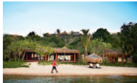
Beach Chalet, Indigo Bay Island Resort and Spa

Einrichtung: Die Lodge umfasst 26 riedgrasgedeckte Bungalows (Standard & Superior) mit Giebeldach und kleiner Veranda. Jedes Chalet verfügt über Klimaanlage, Deckenventilator, Bad/WC und Aussendusche. Zur Lodge gehören das Restaurant, die Bar, ein Schwimmbad und ein kleiner Curio-Shop.