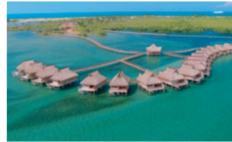
Flamingo Bay Water Lodge

Einrichtung: 20 riedgrasgedeckte Wasser-Chalets liegen auf Stelzen in der Bucht von Inhambane. Jedes der geräumigen Chalets ist in warmen Holzönen eingerichtet und verfügt über Klimaanlage, Moskitonetz, grosse Veranda mit Liegestühlen, Sitzcke sowie Dusche/WC. Von jedem Chalet aus führt eine Holztreppe ins warme Wasser des Indischen Ozeans; Schwimmen und Schnorcheln vor der Haustüre! Alle Chalets sind über einen Holzsteg mit dem