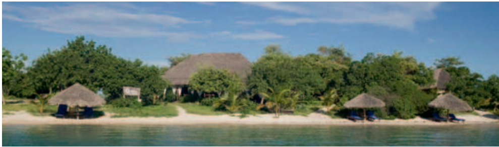
Quilálea Lodge, Lagosta Beach