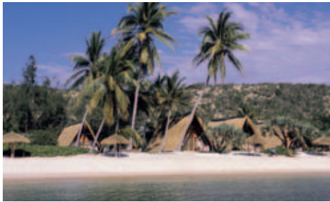
Pestana Bazaruto Lodge