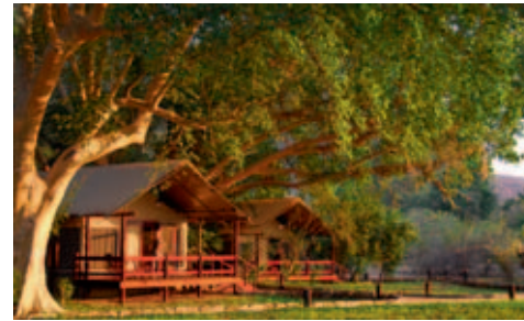
Lugenda Wilderness Camp

Baden, Schnorcheln, Tauchen (PADI-Kurse verfügbar), Fischen, Segeln, Bootsausflüge oder ganz einfach «Relaxen» lassen die Zeit im Nu vergehen.