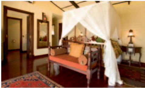
Matemo Island Resort