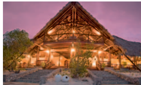
Medjumbe Island Resort

Der Quirimbas Archipelago besteht aus 27 Inseln und erstreckt sich von Süden (nächster Ort ist Pemba) bis weit in den Norden (nach Palma). Die eindruckliche Wasserwelt des Quirimba Nationalparks umfasst über 1500 km 2 und beheimatet 11 Koralleninseln; eine Traumwelt für Schnorchler und Taucher. Die Insel Matemo mit dem Matemo Island Resort liegt knapp 20 Flugminuten von Pemba entfernt. 24 klimatisierte, luxuriöse Chalets verfügen über Bad und/oder Dusche, WC und Minibar. Im Hauptgebäude befindet sich die Lounge, der Essraum und die Bar. Kleiner Pool vorhanden. Medjumbe Island ist mit dem Motorboot von Matemo Island in ca. 45 Minuten erreichbar.