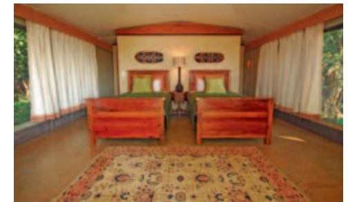
Lugenda Wilderness Camp

befindet. Die Safaris finden im Geländefahrzeug und/oder zu Fuss, selbstverständlich stets unter kundiger Leitung eines Game Rangers, statt.