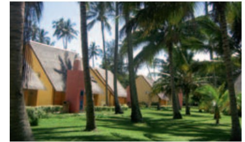
Pestana Inhaca Lodge

Einrichtung: Die malerische Lodge verfügt über total 40 Zimmer (Standardzimmer und Familienzimmer), alle klimatisiert und mit Deckenventilator, TV, Bad/Dusche und WC versehen. Die Lodge hat ein Restaurant; die Mahlzeiten werden sowohl innen wie auch auf der Veranda (mit Blick auf den grossen Salzwasserpool) serviert. Gepflegter Garten. Cocktail Bar und kleiner Curio-Shop vorhanden.