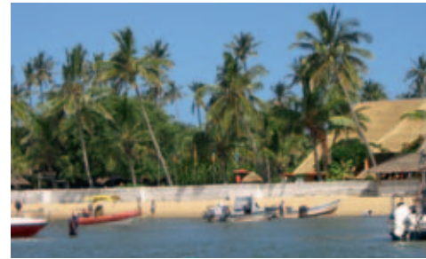
Pestana Inhaca Lodge

Einrichtung: Alle 120 Zimmer (Standard, Executive und Suiten) sind klimatisiert und verfügen über Bad und/oder Dusche, WC, TV und Safe. Im Hauptrestaurant werden alle Mahlzeiten serviert; zusätzlich bietet das Hotel eine Cocktail Bar und einen Coffee Shop. Zu den weiteren Annehmlichkeiten gehören ein grosses Schwimmbad, das Business Center und ein kleines Shopping-Center.