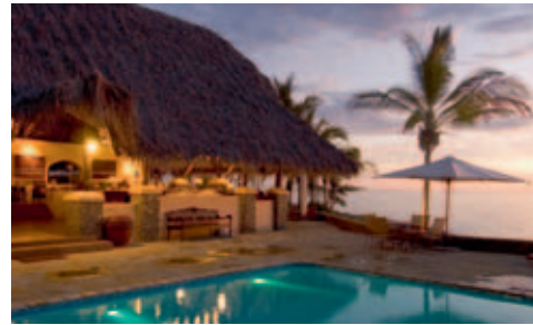
Matemo Island Resort